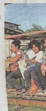
Aux Philippines les voies de ch